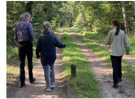
Wandelcoaching naar vitaliteit IPSO DEVENTER ZIEKENHUIS intermeZZo

Wanneer je kanker hebt of hebt gehad moet je vaak opnieuw je grenzen ontdekken of anders vormgeven. Sporten kan lastig zijn. Bewegen tijdens en na kanker bevordert echter wel het lichamelijke herstel. Ook ondersteunt het bij psychische klachten als angst en somberheid. IntermeZZo IPSO centrum voor leven met en na kanker helpt laagdrempelig met bijvoorbeeld wandelcoaching. >lees verder